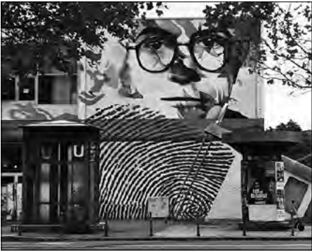
© Trixie Hölsgens - Adorno als street art in Frankfurt am Main (Universiteit, Campus Bockenheim)

Amadeus Den Haag, Traviatastraat 25, 2555 VG Den Haag, inclusief lunch (vrij parkeren; goed bereikbaar met tram3).