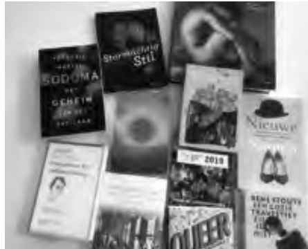
Een blik op de leestafel

Döne Fil verenigt vele identiteiten in zich: Turkse, Amsterdamse, lesbische, moslima, initiator van de Turkse 'Gay Pride' boot in